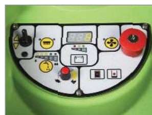
INTUICYJNY PANEL STEROWANIA