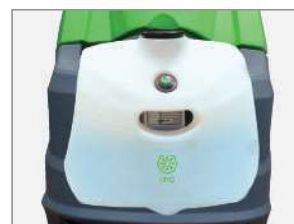
ODDZIELNY SYSTEM DOZOWANIA DETERGENTU. (OPCJONALNY)